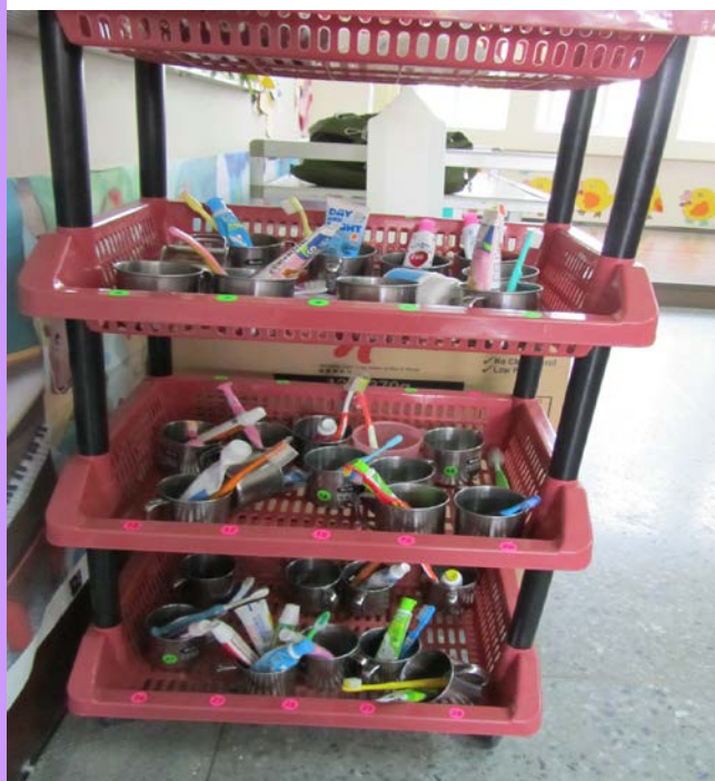
班級牙刷用具擺放整齊